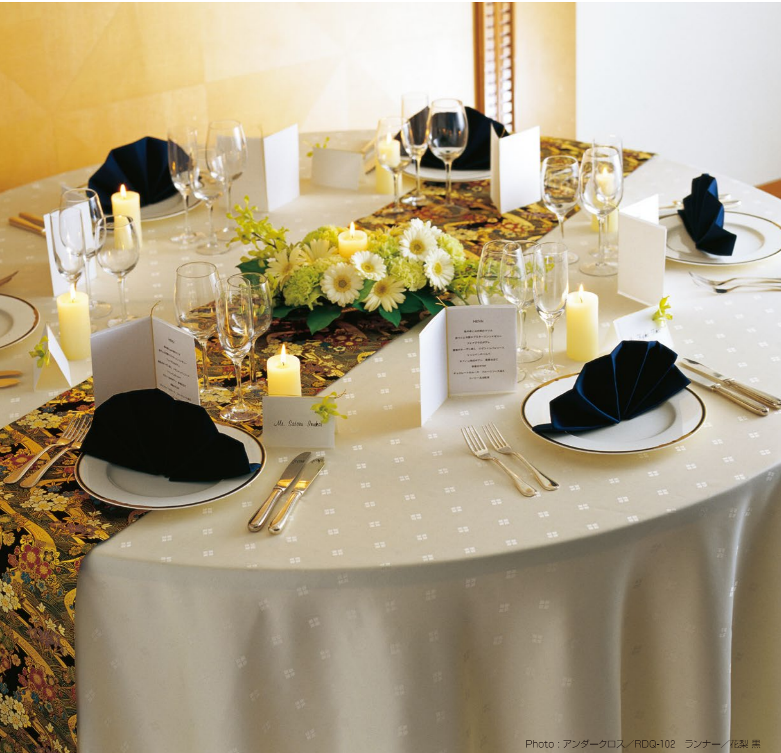
Photo : アンダークロス/RDQ-102 ランナー/花梨 黒

伝統の色でお客様におもてなしの演出・・・華やかに、そしてシックに・・・ お迎えする気持ちを込めて、和の演出提案でアレンジしてみませんか。