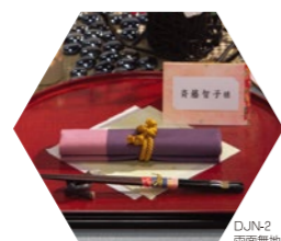
DJN-2 高面無地「薄紫×ローズ」