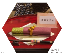
DJN-2 竹に梅「ワイン×利休」